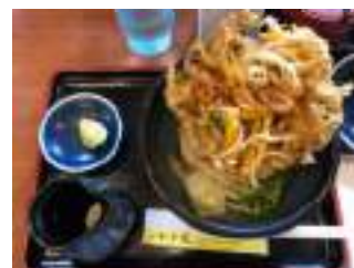
讃岐うどん 香川の「もり家」