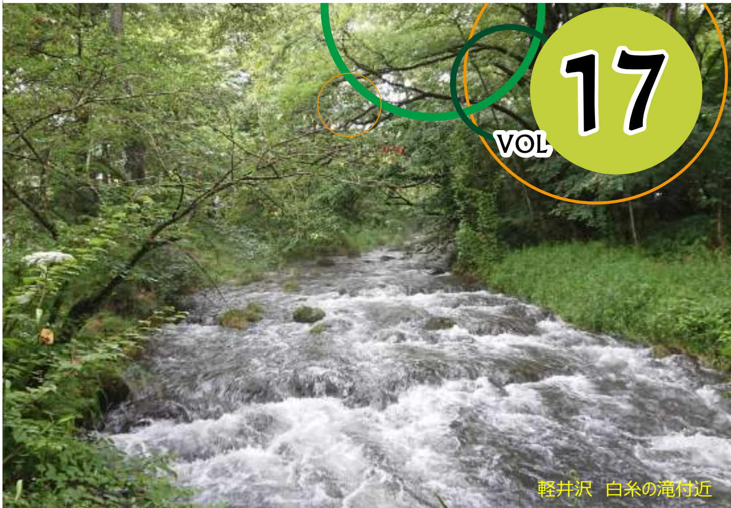
軽井沢 白糸の滝付近